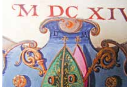
D. Meuss – Monogrammierung D M. (Stiftsbibliothek St. Gallen, Codex 1768, 1614, Seite 1)