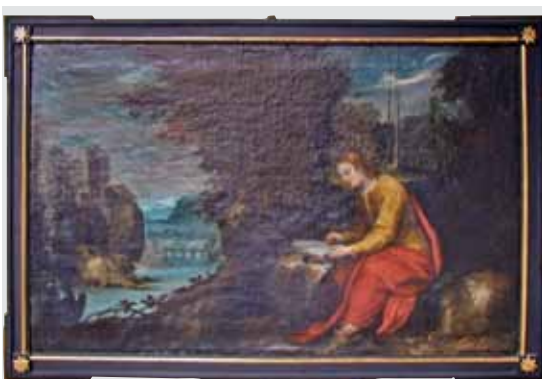
D. Meuss - Evangelist Lucas, 1617 (Feldkirch, Kapuzinerkloster)