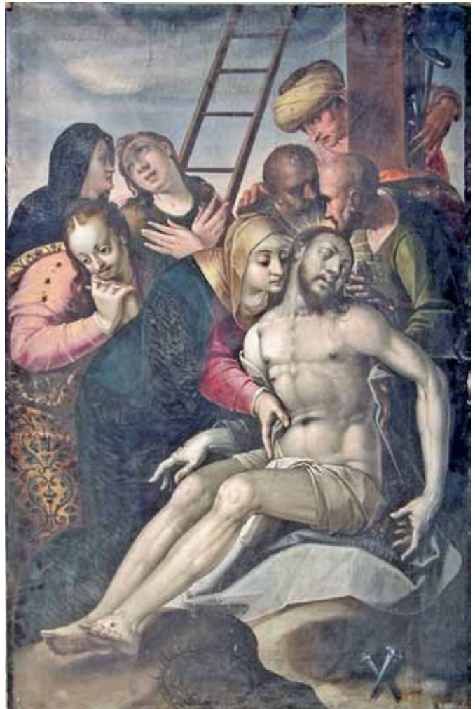
D. Meuss – Pietà, 1610 (Kathedrale, Chur, CH)