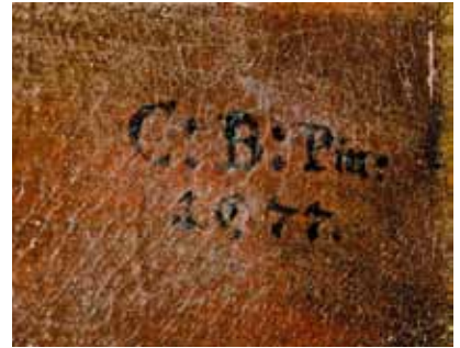
Christoph Bodtmar - Monogrammierung, 1677