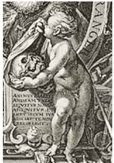
Vorlage von Aegidius Sadeler, aus dem Kupferstich von Barth. Spranger mit Allegorie auf den Tod seiner Frau

che. Auch die Schreiner- und Bildhauerarbeiten wurden ihm übertragen, vermutlich hat er sie aber weiter vergeben 44 . Die beiden Altarblätter „Geißelung“