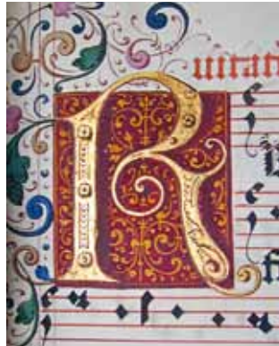
D. Meuss – Gemalte Initiale (Stiftsbibliothek St. Gallen, Codex 1768, 1615, Seite 63)