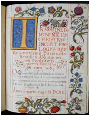
D. Meuss – Buchmalerei (Stiftsbibliothek St. Gallen, Codex 1335, 1607, Seite 13)

Auftrag, mehrere Titelblätter auf Vorrat zu malen, vielleicht blieb aus diesem Grund der Spiegel des kunstvoll gemalten Titelblattes des Codex 1408 leer. Auch privat scheint Abt Bernhard Gefallen an der Kunst des Dietrich Meuss gefunden zu haben, denn 1610 entlohnte er ihn fürstlich mit 30 fl „vowegen deren 3 Tüecher so er in mein Gemach allhie gemalet“ 42 . 1623 erhielt er den Auftrag, den Hochaltar in St. Otmar und die von Hans Schenk geschnitzten Figuren „weiss bruniert“ zu fassen 43 . Gleichzeitig hatte er für diesen Altar drei Tafelbilder zu malen. 1624 übertrug ihm das Stift die Ausführung zweier Seitenaltäre in der Stiftskir-