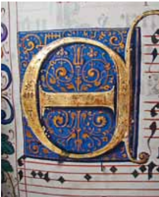
D. Meuss – Gemalte Initiale (Stiftsbibliothek St. Gallen, Codex 1768, 1615, Seite 9)

zufrieden, denn kurze Zeit darauf erhielt er den Auftrag, das vom St. Galler Konventuale P. David Schaller 40 (1581-1636) geschriebene Antiphonarium mit einem Titelblatt und Initialen zu schmücken. Dieses Werk befindet sich, wie die Benedictsregel, heute in der Stiftsbibliothek St. Gallen 41 . Vermutlich erhielt Meuss den