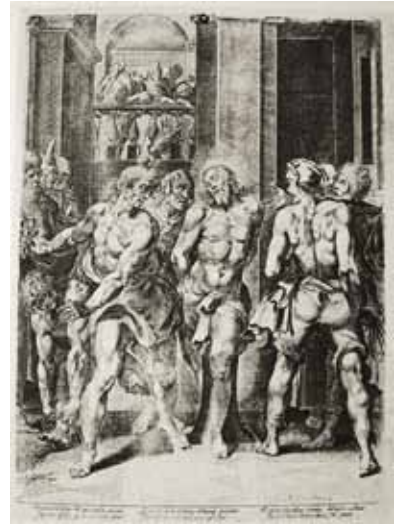
Vorlage von Jean le Clerc, le jeune, für Altarblatt „Christi Geißelung“, 1624