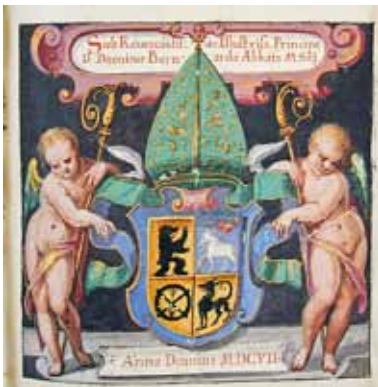
D. Meuss – Buchmalerei (Stiftsbibliothek St. Gallen, Codex 1335, 1607, Seite 9)

Auftrag, mehrere Titelblätter auf Vorrat zu malen, vielleicht blieb aus diesem Grund der Spiegel des kunstvoll gemalten Titelblattes des Codex 1408 leer. Auch privat scheint Abt Bernhard Gefallen an der Kunst des Dietrich Meuss gefunden zu haben, denn 1610 entlohnte er ihn fürstlich mit 30 fl „vowegen deren 3 Tüecher so er in mein Gemach allhie gemalet“ 42 . 1623 erhielt er den Auftrag, den Hochaltar in St. Otmar und die von Hans Schenk geschnitzten Figuren „weiss bruniert“ zu fassen 43 . Gleichzeitig hatte er für diesen Altar drei Tafelbilder zu malen. 1624 übertrug ihm das Stift die Ausführung zweier Seitenaltäre in der Stiftskir-