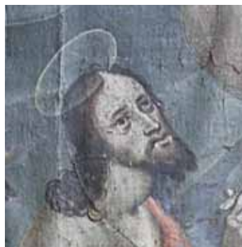
D. Meuss - Ölberg, 1607, Ausschnitt mit Christuskopf (Kloster St. Katharina, Wil, CH)