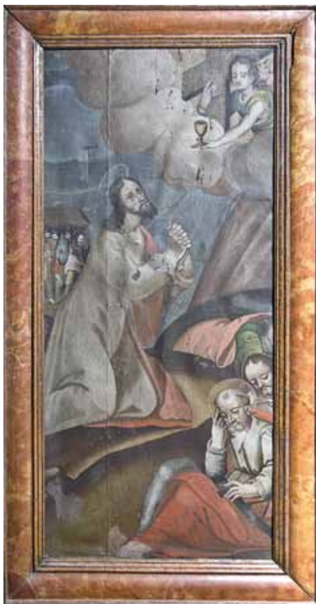
D. Meuss - Ölberg, 1607 (Kloster St. Katharina, Wil, CH)