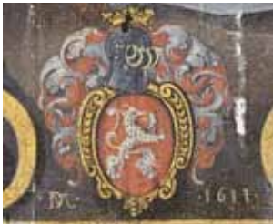
D. Meuss – Monogrammierung auf dem Beweinungsbild, 1610 (Kathedrale, Chur, CH)