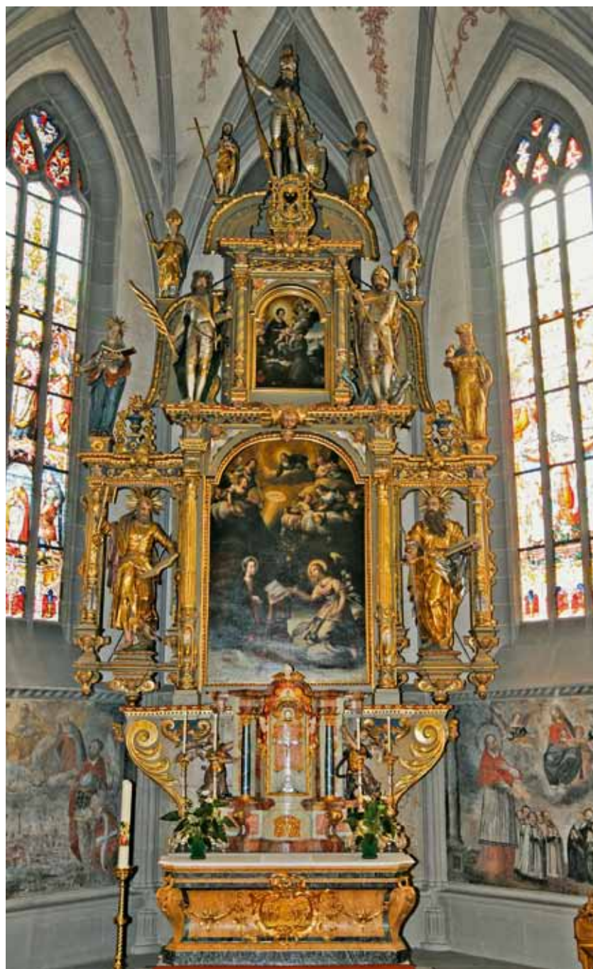
Pfarrkirche Appenzell (CH), mit Altarblatt von D. Meuss, 1622