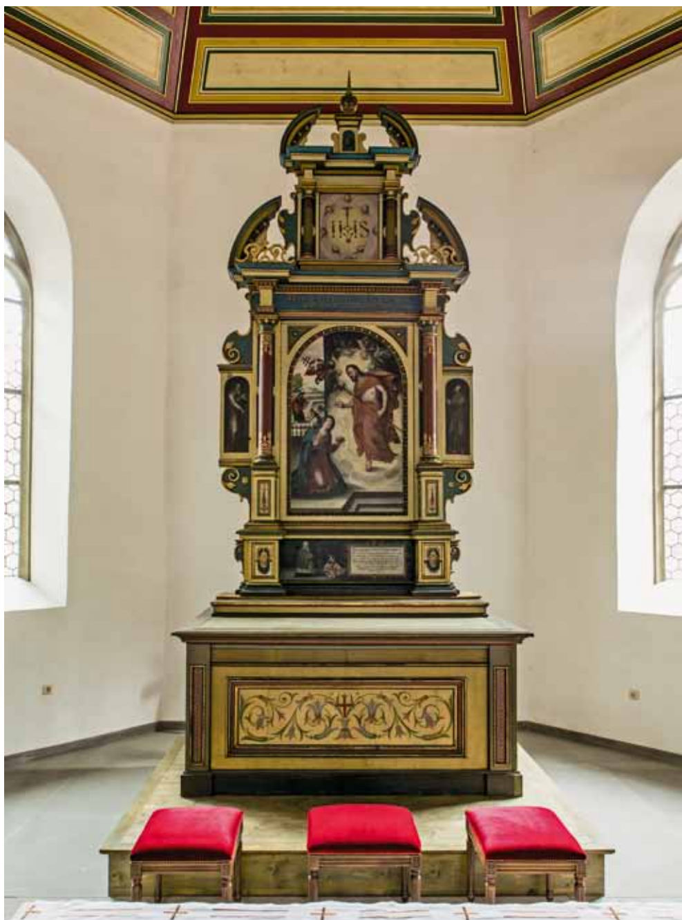
Feldkirch, Friedhofskirche St. Peter und Paul, Altarfassung und Altarblatt „Christi Erscheinung“ von D. Meuss, 1615