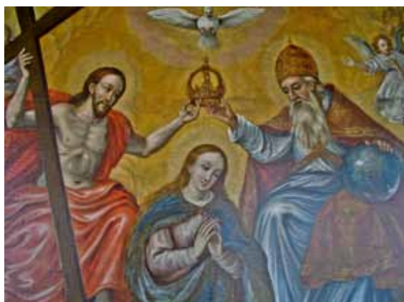
D. Meuss – Altarblatt mit Maria Krönung (Ausschnitt), 1618 (Kloster Tübach bei Rorschach, CH)