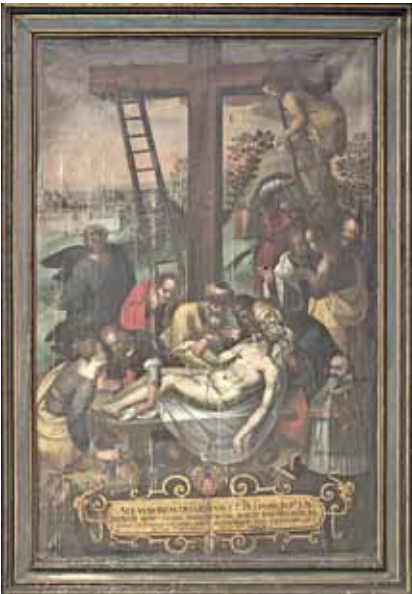
D. Meuss – Beweinungsbild, 1610 (Kathedrale, Chur, CH)