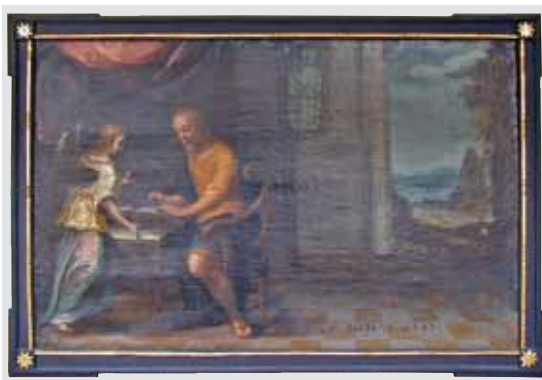
D. Meuss - Evangelist Mathäus, 1617 (Feldkirch, Kapuzinerkloster)