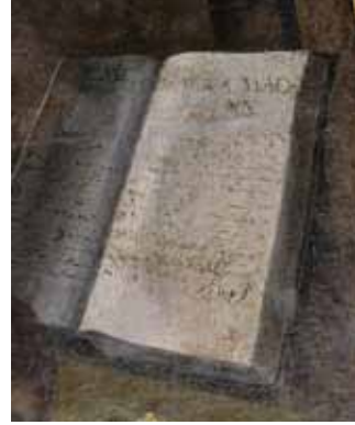
Hans Caspar Hohensin - Signatur, 1649