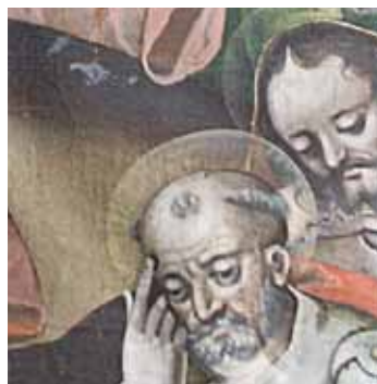
D. Meuss - Ölberg, 1607, Ausschnitt mit Hl. Petrus (Kloster St. Katharina, Wil, CH)