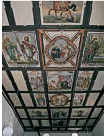
Christian Lutz - Kassettendecke in der Kirche von Beschling, 1686