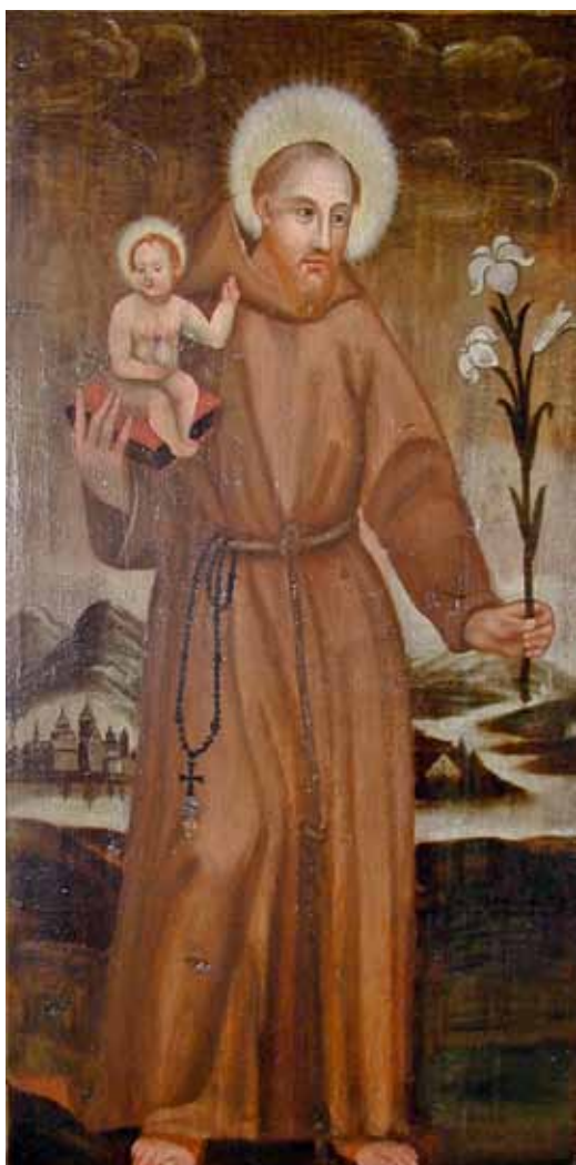
D. Meuss – Hl. Antonius mit Jesuskind, 1618 (Kloster Tübach bei Rorschach, CH)