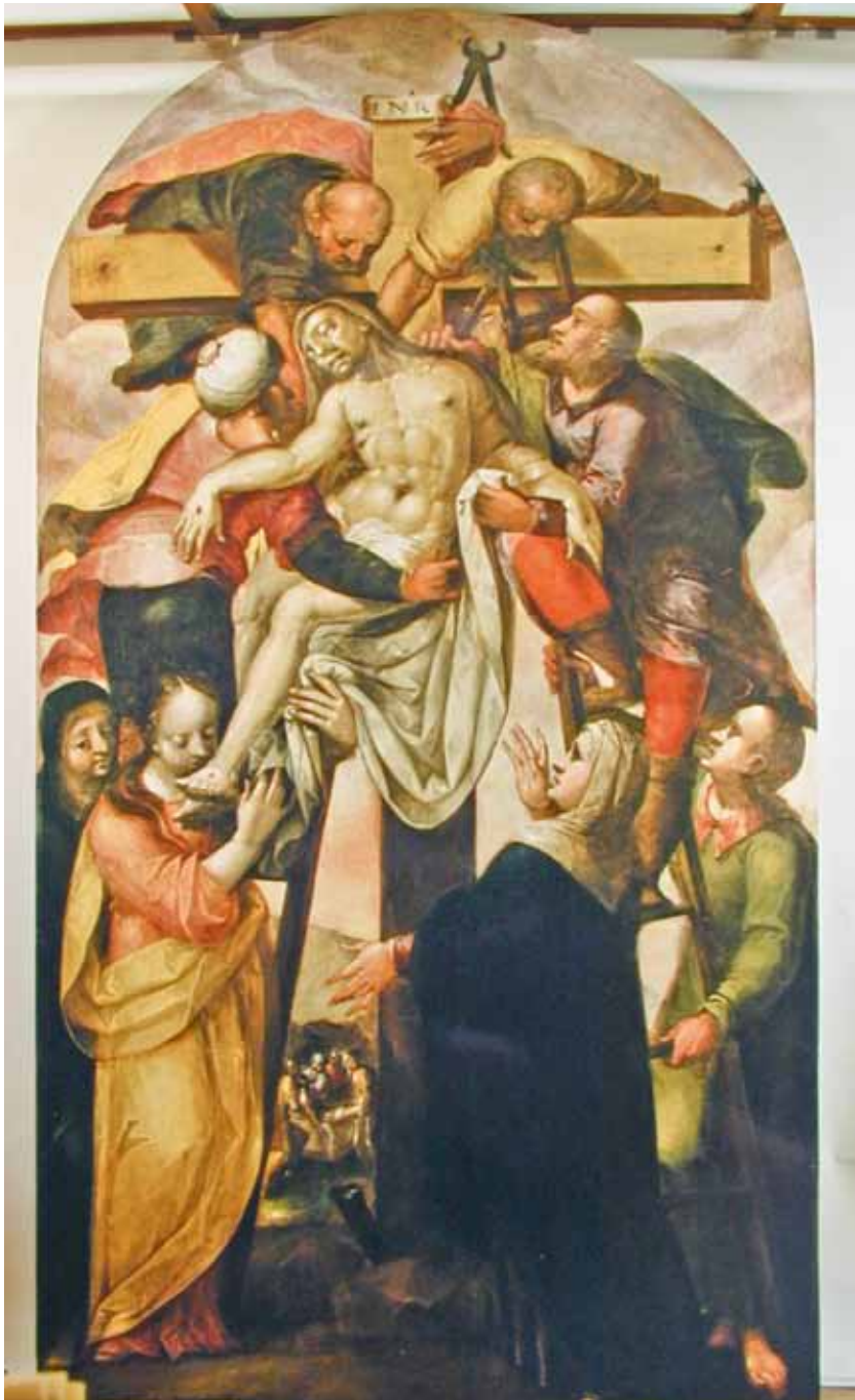
D. Meuss - Kreuzabnahme, 1607 (Kloster St. Katharina, Wil, CH)